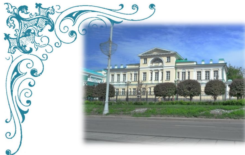
Аптека горного ведомства 1820-1821 годы