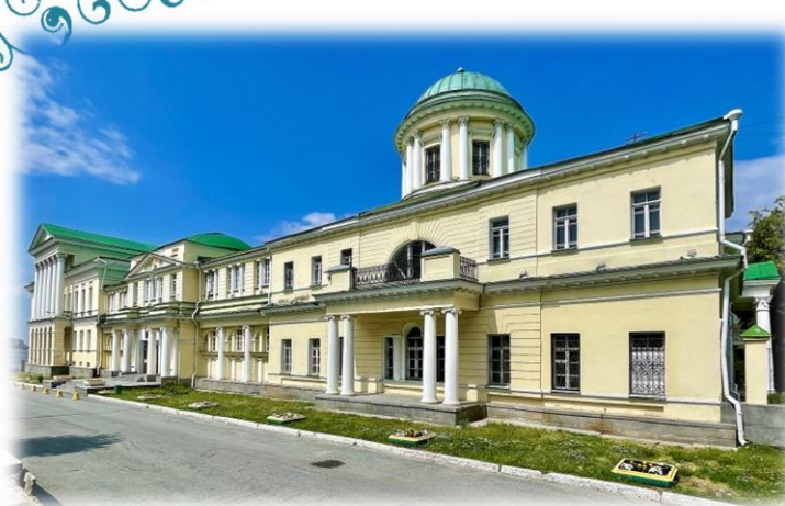
Усадьба Расторгуевых-Харитоновых 1794-1824 годы

Усадьба - типичный образец городских усадеб первой трети XIX века в стиле классицизма. Композиция её асимметрична, угловое положение главного дома придаёт ей представительный вид с городских улиц. Парк при усадьбе расположен позади дома, имеет искусственное озеро с ротондой на острове. Главные аллеи образуют трёхлучие, в фокусе которого и стоит ротонда. Некоторые лиственницы и липы в нижней части парка имеют возраст свыше 200 лет и являются самыми старыми деревьями в городе. К усадьбе примыкает парк Харитоновский сад, один из самых больших парков Екатеринбурга.