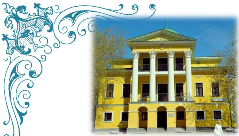
Дача великого архитектора Малахова 1817 г

Дом представляет собой компактный двухэтажный объем с мезонином и центральной купольной ротондой. Все фасады здания рассчитаны на круговой обход.