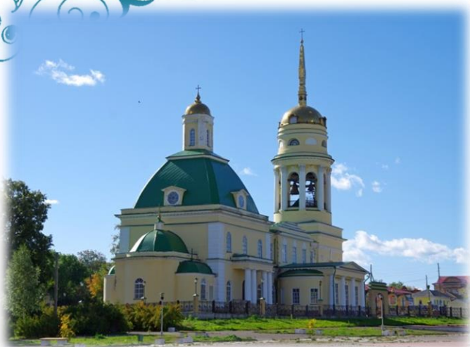
Свято-Троицкий кафедральный собор. 1808 г.

Сочетание старой, сохранившей классические черты, основной части храма и части, отстроенной уже в период расцвета стиля классицизма, придают особое очарование, свойственное лучшим сооружениям школы Малахова.