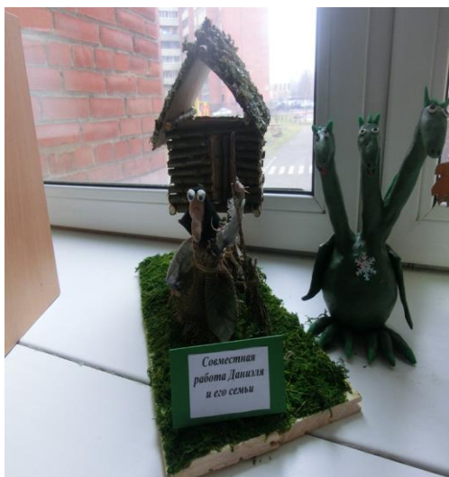
Избушка на куриных ножках