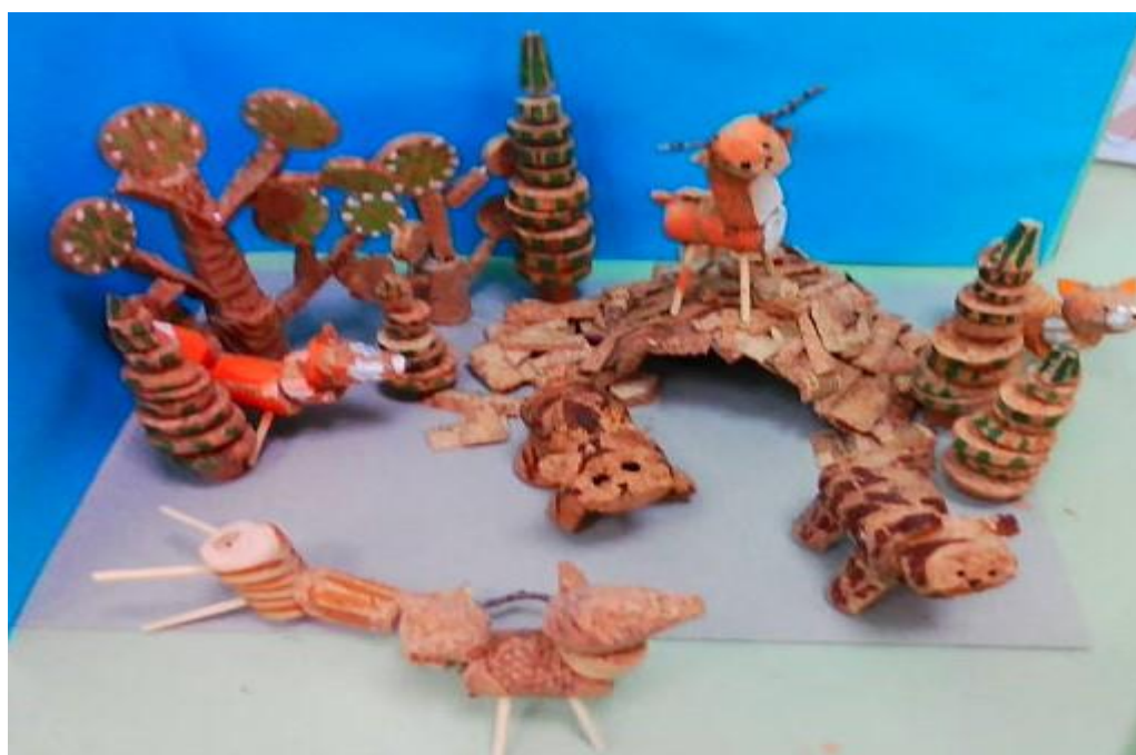
Творческая работа по сказке «Колобок» (дети старшей группы)