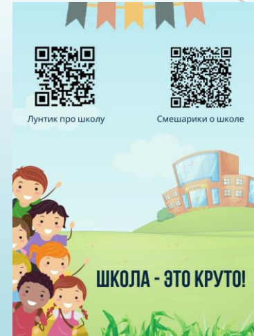
ЧАСТЬ ИНФОРМАЦИИ ОБЯЗАТЕЛЬНО ОФОРМЛЕНА В QR-КОДАХ (с пожеланиями обсудить, поиграть, почитать, воспользоваться дома с ребёнком)