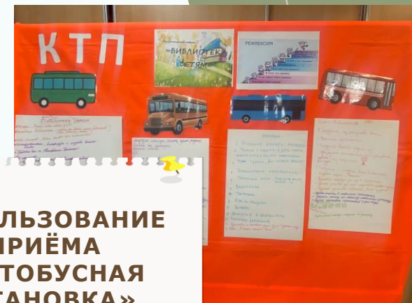
ИСПОЛЬЗОВАНИЕ ПРИЁМА «АВТОБУСНАЯ ОСТАНОВКА»