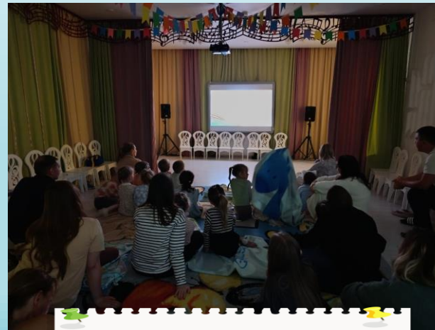
СОБРАНИЕ В ФОРМАТЕ КИНОПЕДАГОГИКИ