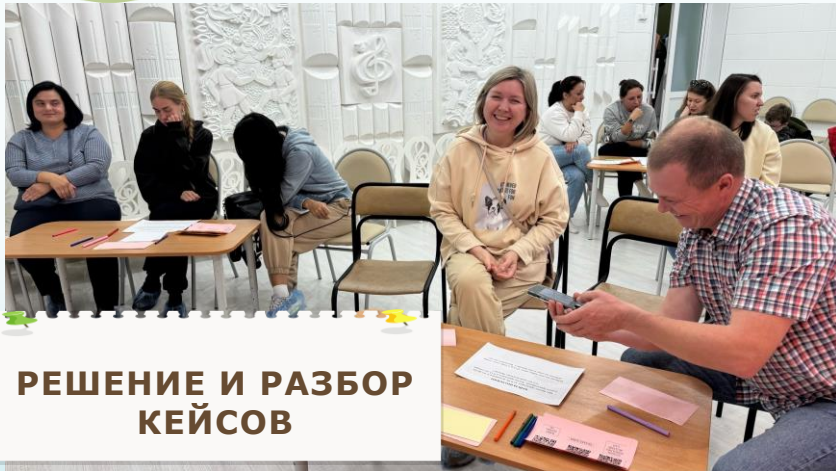
РЕШЕНИЕ И РАЗБОР КЕЙСОВ