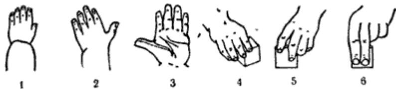
Рис. 3. Этапы развития функций кисти руки ребенка: 1 - положение кисти в 16 недель, 2 и 3 - в 56 недель, 4 - в 60 недель, 5 - в 3 года, 6 - взрослый.

На рис. 3 показано, как совершенствуются движения пальцев рук в процессе развития ребенка. Особое значение имеет период, когда начинается противопоставление большого пальца другим - с этого времени и движения остальных пальцев становятся более свободными.